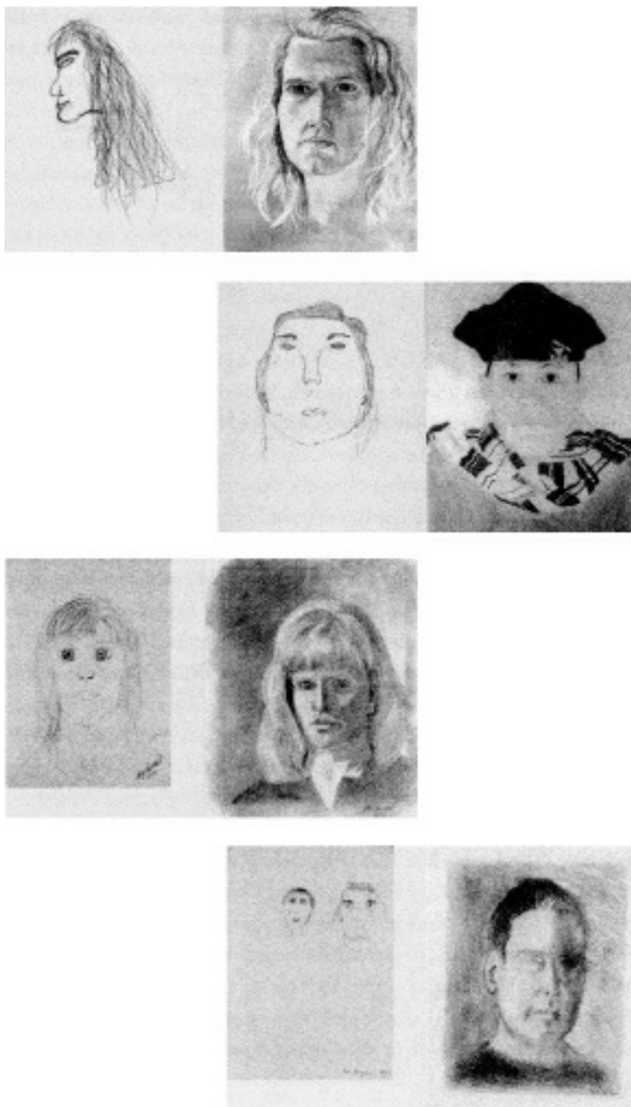
图 1 画作对比

（ Drawing on the Right side of the Brain ）这本书时我的惊讶和喜悦。你可以在图 1 中看到参加了这本书作者贝蒂·爱德华兹（Betty Edwards）的短期绘画课程后的一些学生自画像的对比：左边是学生们刚进入培训班时的自画像，右边是五天的课程结束后他们的自画像。